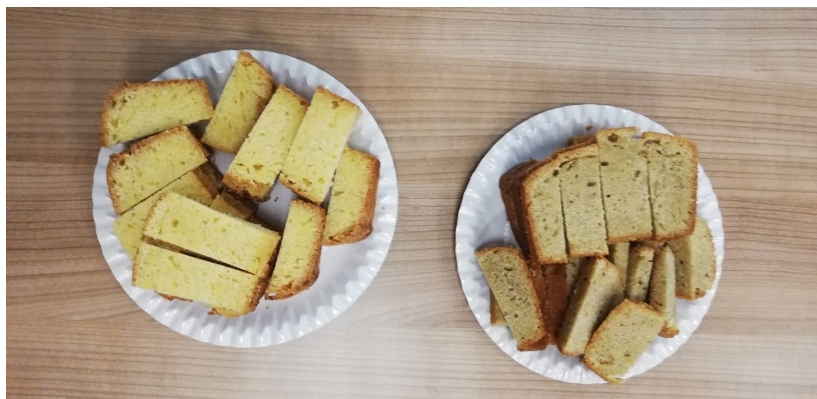
Figuur 2 Cake gebruikt bij proeverij. Cake zonder meelwormingrediënten (links) en cake met meelwormingrediënten (rechts)